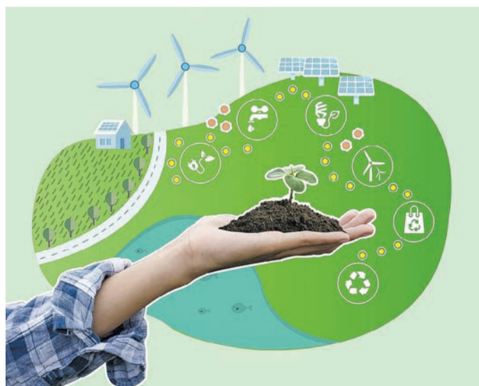
A szakemberek képzése elengedhetetlen feladat a XXI. században

lis képet kapnak a klímaváltozás aktuális helyzetéről, megtudják, hogy a zöldgazdaság elveinek használatával hogyan járulnak hozzá a globális klímaváltozás által okozott hatások lassításához és a kibocsátások csökkentéséhez. Lehetőség lesz megismerni azokat a környezetvédelmi szempontokat, amelyeket a munkájuk során az alapanyag kiválasztásától és hulladékká válásig figyelembe kell venniük.