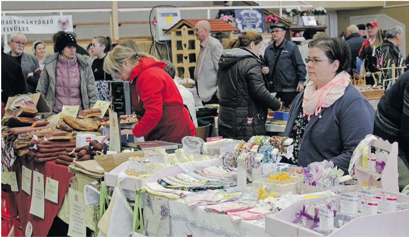
A Duna-Tisza közli Agrár Expo 2024. március 23–24. között kerül megrendezésre Kiskőrös Városi Sportcsarnokában. A kamara támogatja a vállalkozók megjelenését a kiállításon

A térítésmentes rendezvényeken, fórumokon a vállalkozók tájékoztatást kapnak az aktuális gazdasági folyamatokról, eseményekről, célokról, tapasztalatcserét folytathatnak a térség más vállalkozásvezetőivel, elmondhatják a gazdasági környezetüket terhelő problémákat, megoldási javaslatokat