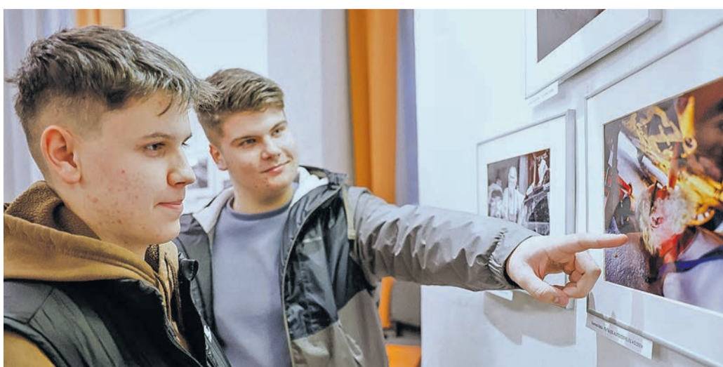
A fiatalokat is érdekelte a kamarai fotókiállítás

fontosnak tartja, hogy a különböző iparosok, szolgáltatók, kereskedők és kézművesek tevékenységét népszerűsítse, értékteremtő munkájukat megbecsülje. Ezek a vállalkozások munkáltatói potenciáljuk révén is különösen fontos gazdasági erő képviselnek. – A munkás emberek, vállalkozók számára az a tevékenység, amit ők végeznek, mindennapos, szokványos, nem találhat benne különösét, viszont amikor a fotós a kameráján keresztül szemléli a világot, megtalálja benne azt, ami mégis különleges, és egy jó kép egy hangulatot, életérzést tud közölni. Amikor a közönség